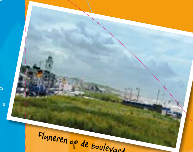
Flaneren op de boulevard

Duinhuiseje 6 (6 pers. bungalow): het woongedeelte en de eethoek zijn gescheiden middels een statige trap naar de verdieping. Keuken met vaatwasmachine, grote koel-/vrieskast en magnetron. De slaapkamer op de begane grond heeft 2 éénpersoonsbedden en extra tv. Boven bevinden zich nog twee slaapkamers met ieder 2 éénpersoonsbedden. Beneden is een badkamer met ligbad, apart toilet en bergruimte. Boven is een tweede badkamer met douche en toilet.