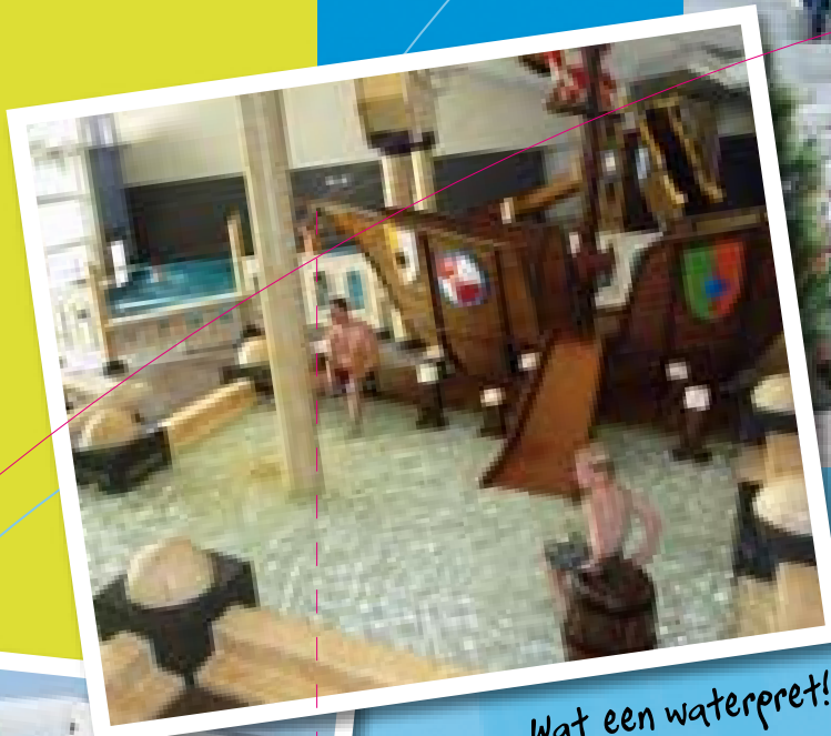
Wat een waterpret!