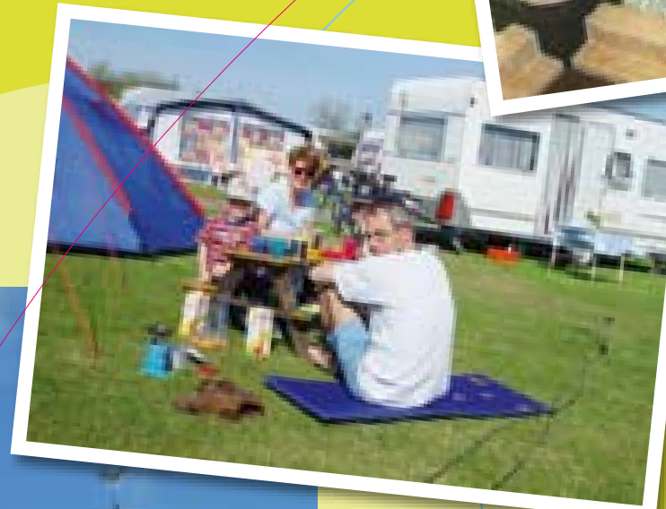
Picknicken bij de tent!

Neem ook eens een kijkje in het Museum "Oud Katwijk" met z'n schitterende collectie van schilders die ooit in Katwijk zijn geweest. Hier is de historie nog altijd voelbaar. In de binnenjachthaven heerst altijd een gezellige drukte. Een gezellige dag voor u en uw kinderen is verzekerd met een tocht naar de Kagerplassen met rederij Triton.