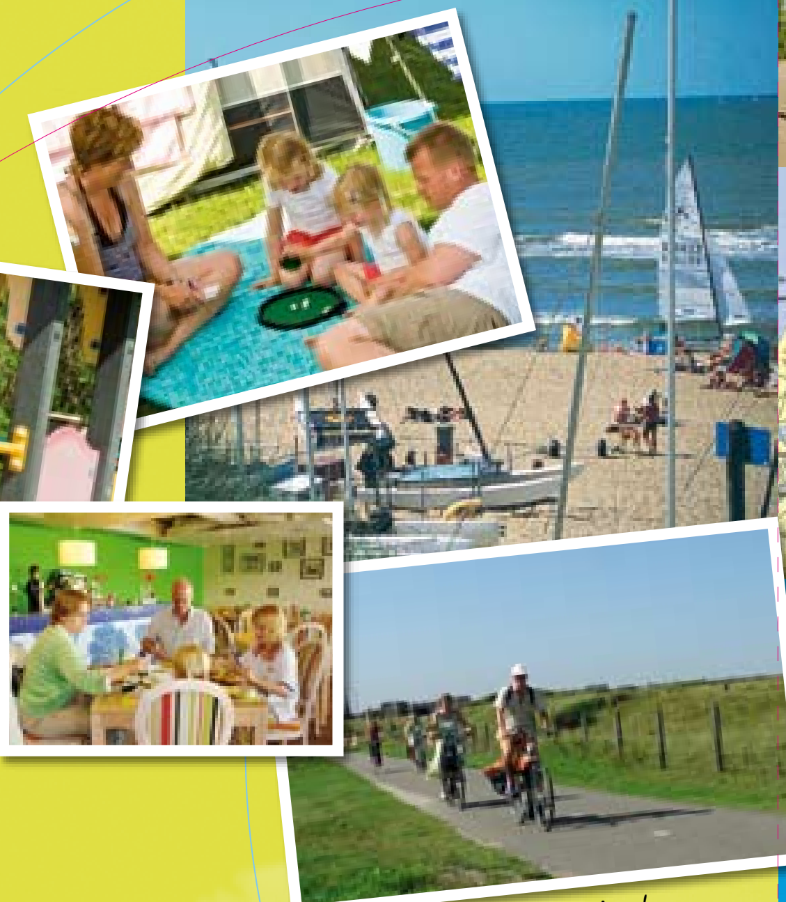
Lekker struinen door de duinen!